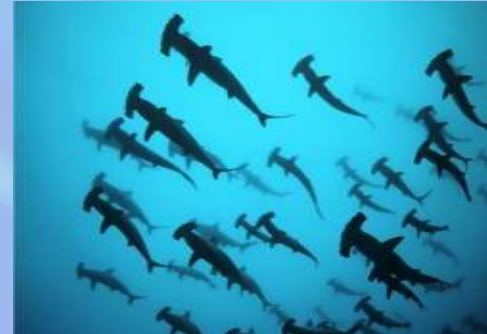
Sphyrna lewini , S. mokarran , S. zygaena (requins-marteaux)