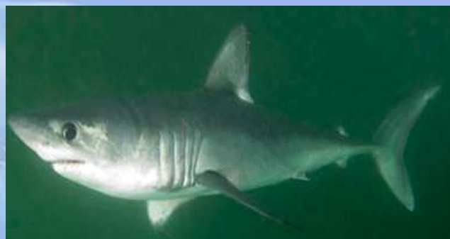
Lamna nasus (requin-taupe commun)