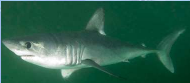
Lamna nasus *

(Allemagne, Belgique, Chypre, Danemark, Espagne, Estonie, Finlande, France, Grèce, Irlande, Italie, Lettonie, Lituanie, Malte, Pays-Bas, Pologne, Portugal, Royaume-Uni de Grande-Bretagne et d'Irlande du Nord, Slovaquie et Suède)