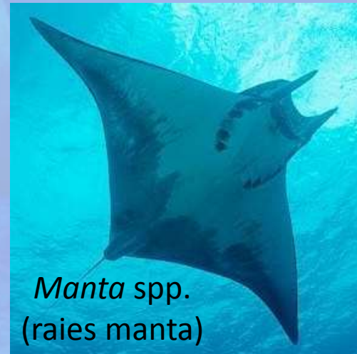
Manta spp. (raies manta)