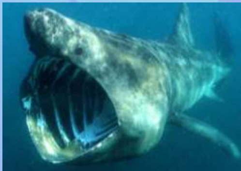
Cetorhinus maximus (requin pélerin)