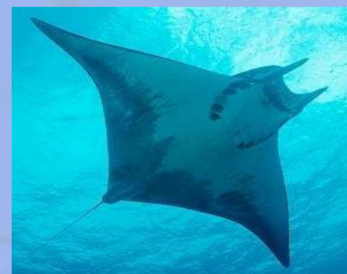
Manta spp. (raies manta)

Entrée en vigueur reportée au 14 septembre 2014