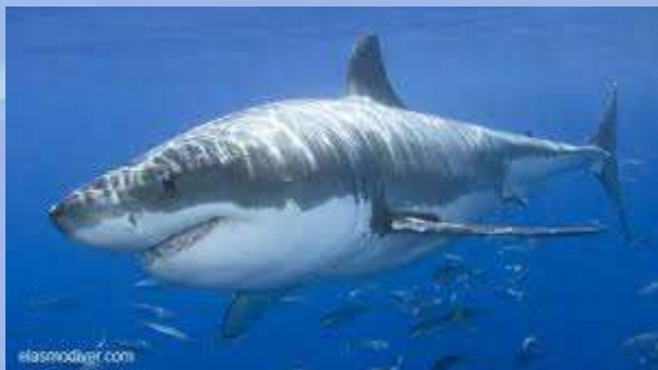
Carcharodon carcharias (grad requin blanc)