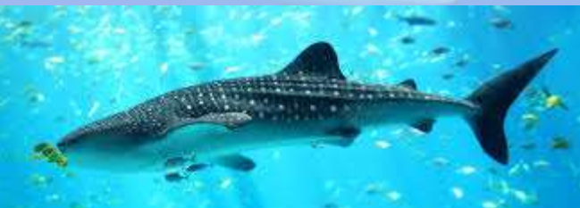
Rhincodon typus (requin-baleine)