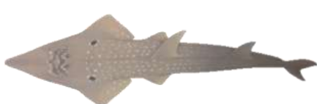
Figure 2: Rhynchobatus djiddensis . De Last et al 2016.