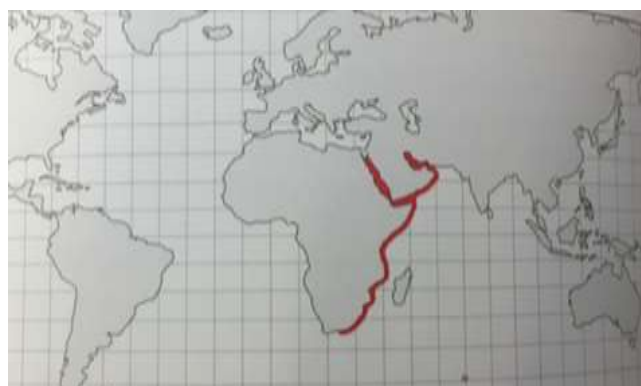
Figure 4. Répartition de R. djiddensis (Last et al. 2016)