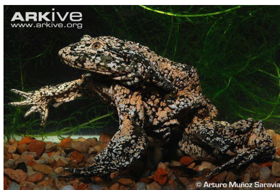
Figure 1. Telmatobius culeus , vue latérale