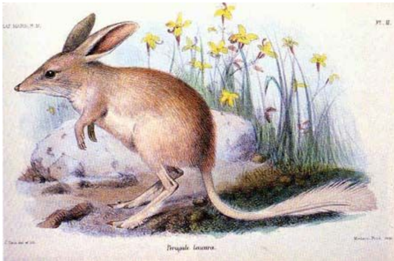
Figure 1 Bandicoot-lapin à queue blanche – dessin de John Gould (Richter, 1863).

Le bandicoot-lapin à queue blanche était strictement nocturne et on dit qu'il mangeait de petits rongeurs, des graines, des termites, des fourmis et d'autres insectes (Finlayson, 1935; Dixon, 1988). Les aborigènes pensent que le bandicoot-lapin à queue blanche mangeait des termites, des fourmis et des racines (Burbidge et coll. , 1988). Le grand bandicoot-lapin (et probablement aussi le bandicoot-lapin à queue blanche) avait un métabolisme réduit par rapport à celui, d'un niveau déjà faible, des autres marsupiaux, et il a été suggéré que cela s'expliquait par une adaptation aux contraintes énergétiques de son environnement aride (Hulbert et Dawson, 1974).