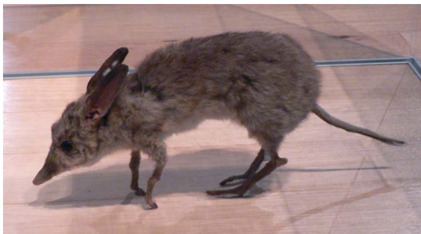
Figure 2 Bandicoot à pieds de porc naturalisé, Museum de Melbourne, Australie.