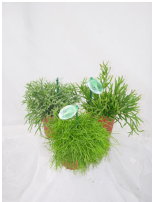
Rhipsalis spp. reproduits artificiellement dans le commerce. Souvent, on ne reconnaît pas ces espèces comme étant des cactus.