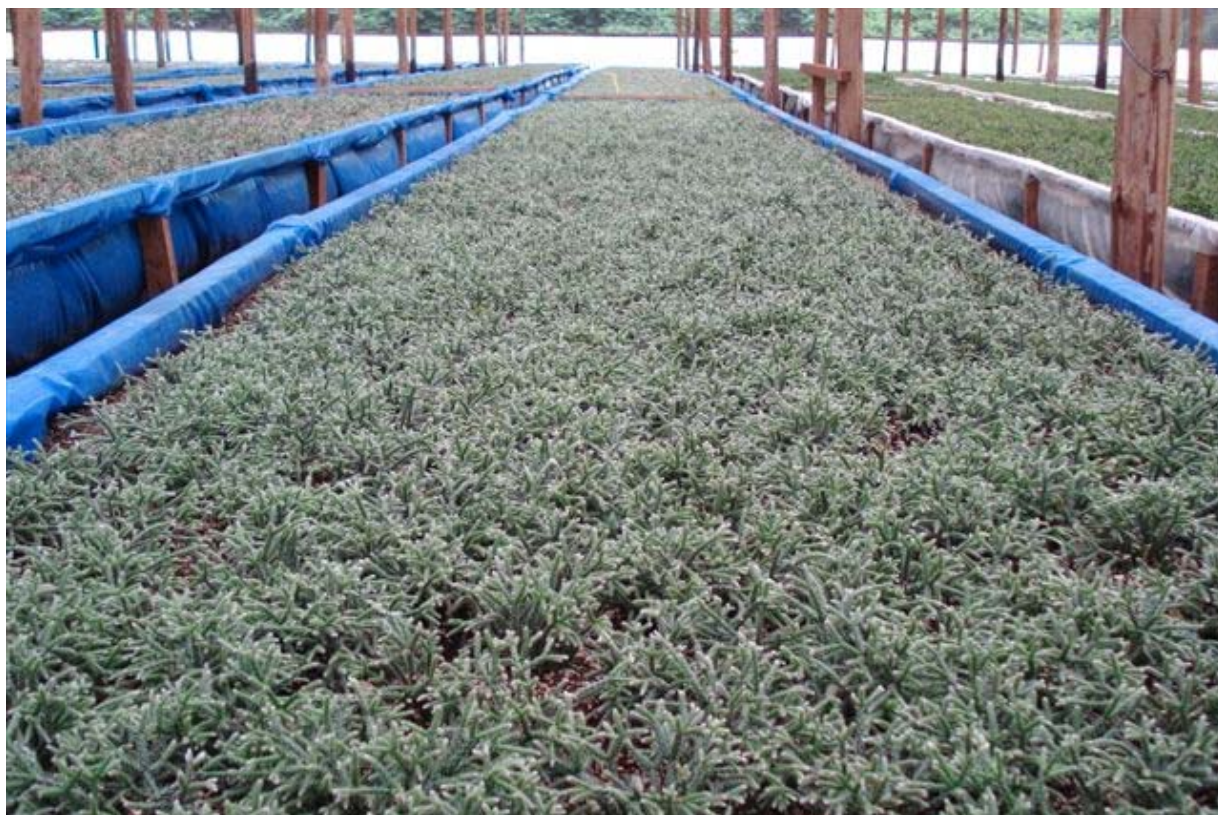
Production industrielle de Rhipsalis sp. en Afrique de l'Est, destinée au commerce international