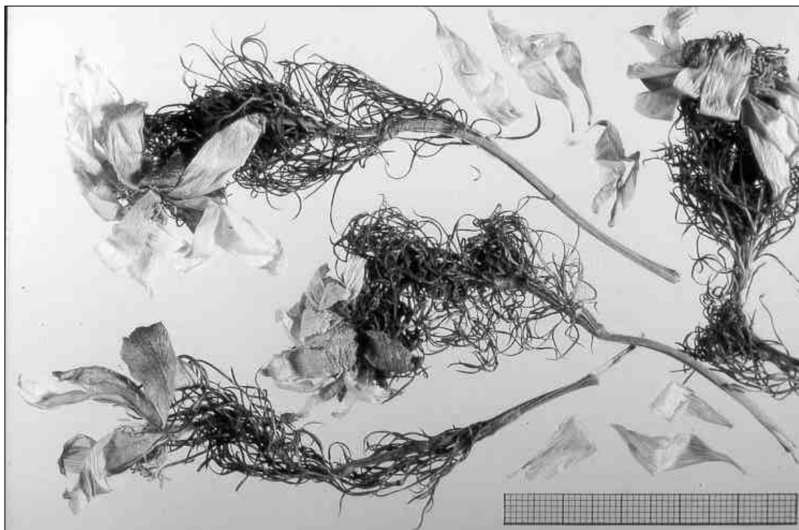
Figure 2. Substance brute d'Adonis avec fleurs.

vernalis tous les 10 m 2 pour assurer la production des graines, et la récolte n'était autorisée que tous les 4 ans dans chaque zone de prélèvement.