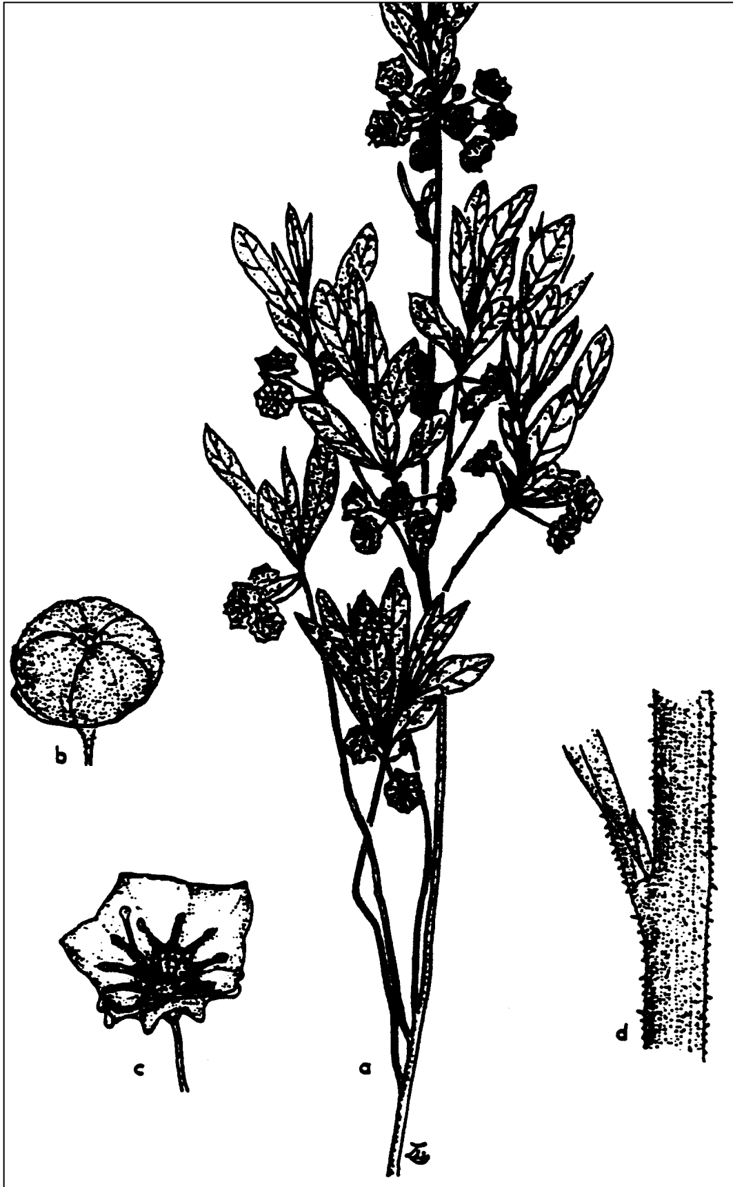
Figure 1. Dessin de Kalmia cuneata . Copié de Rayner (1980).