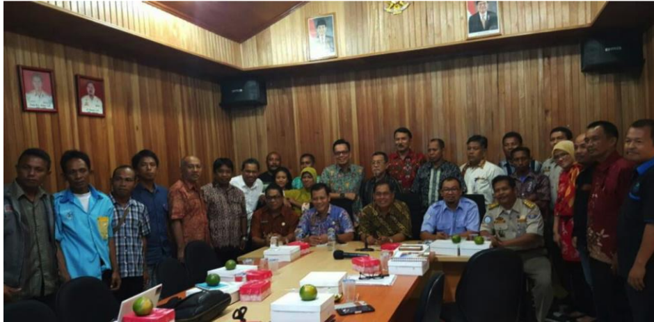
Figure 1. Réunion avec le gouvernement local et les parties prenantes des îles Banggai