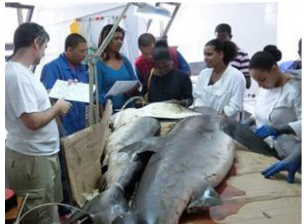
© M.N. Santos - Workshops 2014, 2015