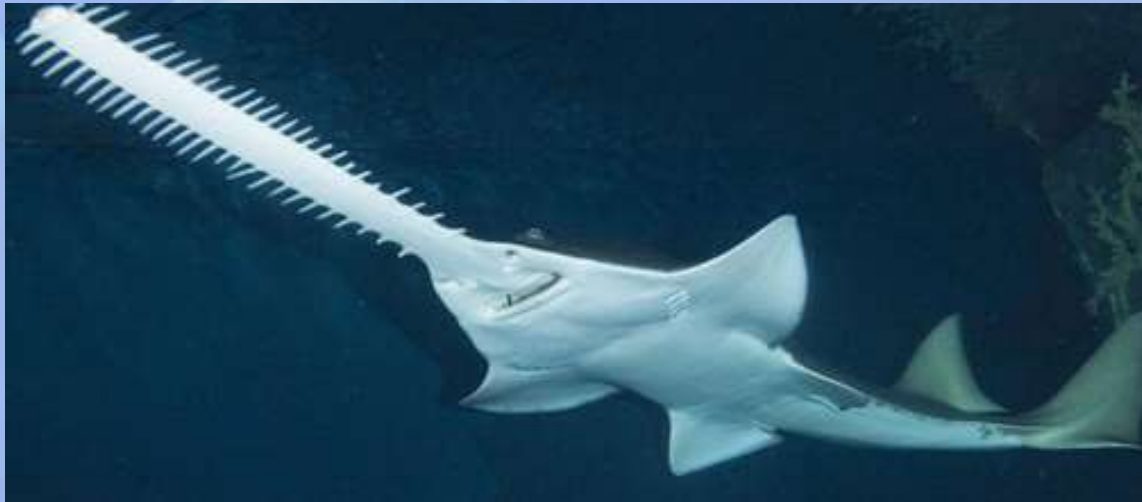
Peces sierra: Pristidae spp.