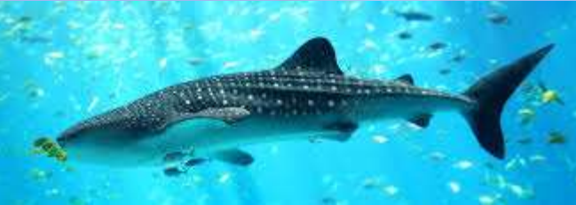
Rhincodon typus (Tiburón ballena)