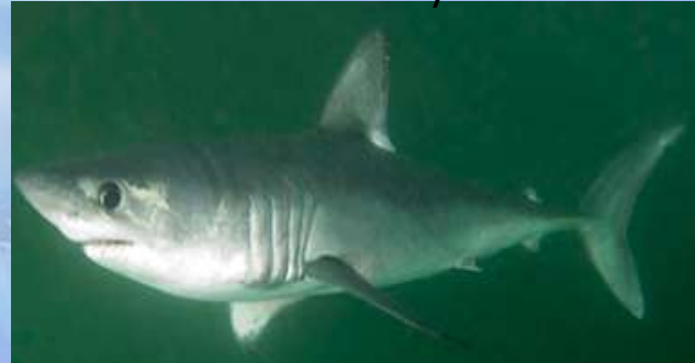
Lamna nasus (Marrajo sardinero)