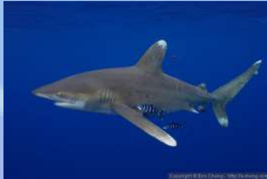
Carcharhinus longimanus (Tiburón oceánico de puntas blancas)