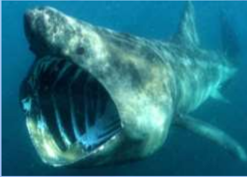
Cetorhinus maximus (Tiburón peregrino)