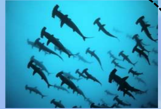
Sphyrna lewini, S. mokarran, S. zygaena (Tiburones martillo)