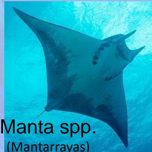
Manta spp. (Mantarrayas)