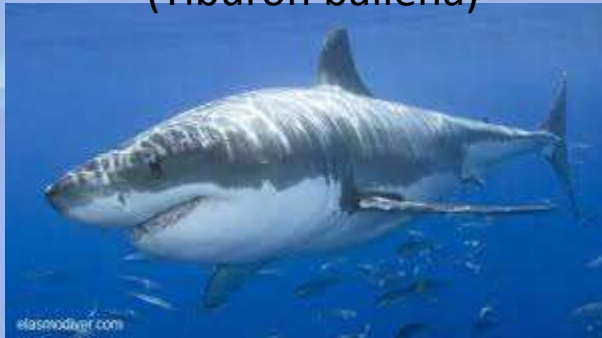
Carcharodon carcharias (Gran tiburón blanco)