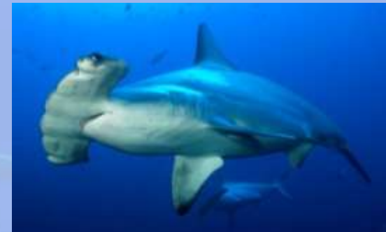
Sphyrna lewini *

(Alemania, Bélgica, Chipre, Dinamarca, Eslovenia, España, Estonia, Finlandia, Francia, Grecia, Irlanda, Italia, Letonia, Lituania, Malta, Países Bajos, Polonia, Portugal, Reino Unido de Gran Bretaña e Irlanda del Norte y Suecia)