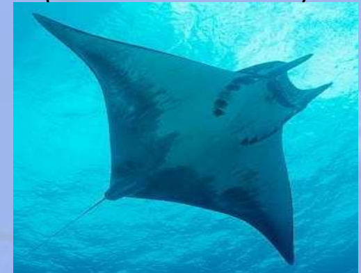
Manta spp. (Mantarrayas)

Entrada en vigor aplazada hasta el 14 de septiembre de 2014