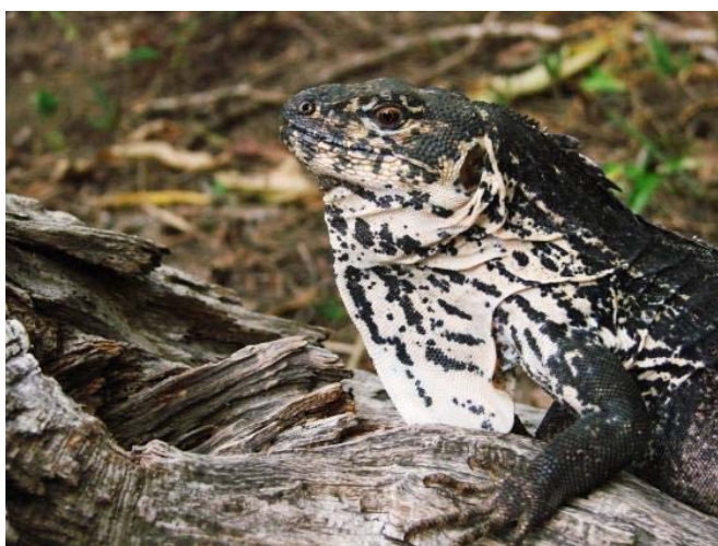
Figura 2. Iguana de Órgano, Ctenosaura pectoralis.

Los adultos presentan una coloración gris plateada, parda, gris o azulada; varias franjas transversales oscuras sobre su dorso, que generalmente tienen un centro claro en la parte media de éste. Los miembros y la parte posterior del cuerpo presentan unas manchas o bandas de color negro y el vientre es de color gris pálido a blanuzco o con el área central de color cremoso (Köhler 2003; Campbell 1998). Durante la época de reproducción, los machos presentan una coloración anaranjada en la cabeza, o manchas rojizas o anaranjadas en la superficie dorsal (Lee 2000).