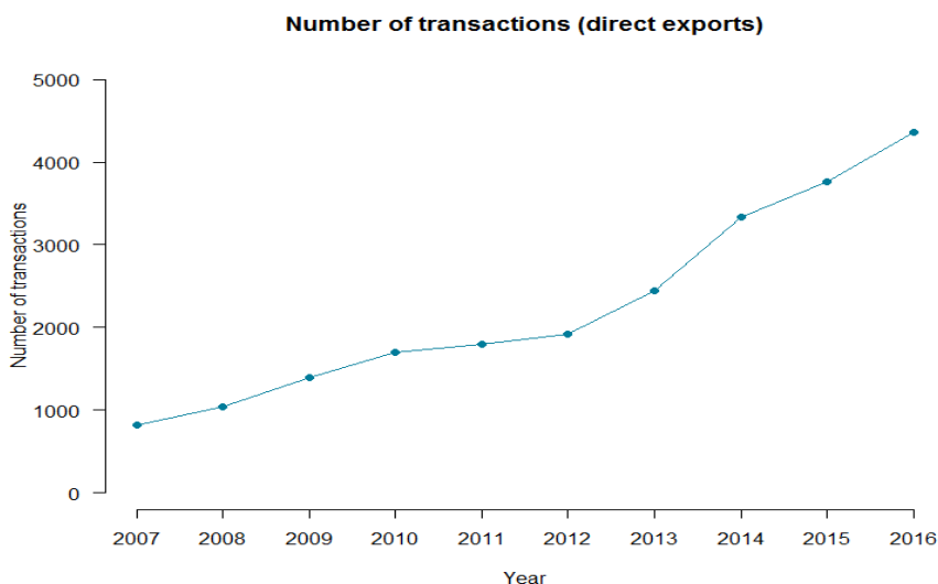
484 Figura 1: Exportación de especies incluidas en el Apéndice I y criadas en cautividad para fines comerciales 485 de establecimientos no registrados.

475 Los procedimientos para la inscripción de los establecimientos de manera que puedan acogerse a las 476 disposiciones especiales del párrafo 4 del Artículo VII son rigurosos. No obstante, muchas Partes no 477 aplican esta resolución. Algunas de estas Partes tienen en su territorio un gran número de 478 establecimientos comerciales de cría en cautividad. Esto conduce a un enfoque incoherente, ya que 479 muchos especímenes de animales incluidos en el Apéndice I y criados en cautividad se exportan de 480 establecimientos no registrados que utilizan el código de propósito "T" para las transacciones 481 comerciales. Durante el período de 2007 a 2016, se realizaron 22.650 exportaciones de este tipo, de 482 110 taxones incluidos en el Apéndice I. Las especies principales fueron aves rapaces y loros. La 483 tendencia de este tipo de comercio está aumentando.