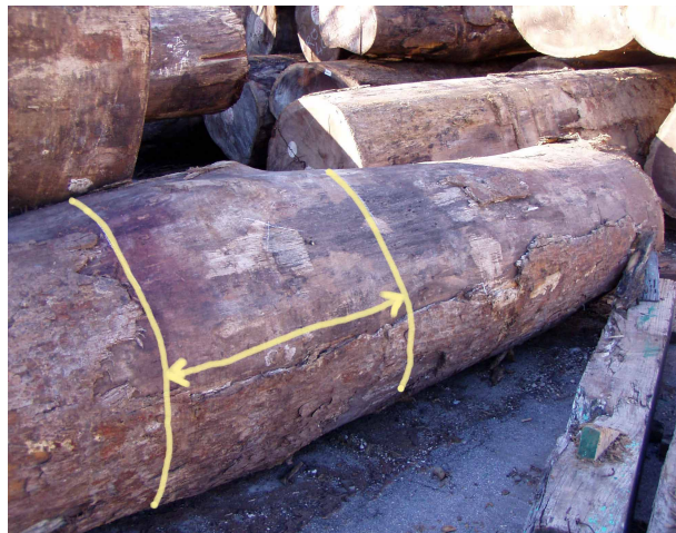
Figura 3: Troza defectuosa

Al determinar volúmenes, se permite un margen de troceo máximo de 3% por lote, y se excluyen de la medición las partes de la troza que presenten defectos evidentes (véase la figura 3).