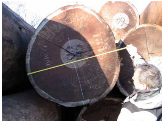
Figura 2: Medición del diámetro

En el caso de determinadas especies de madera, cuya albura suele pudrirse fácilmente, se debe excluir la albura al medir los diámetros.