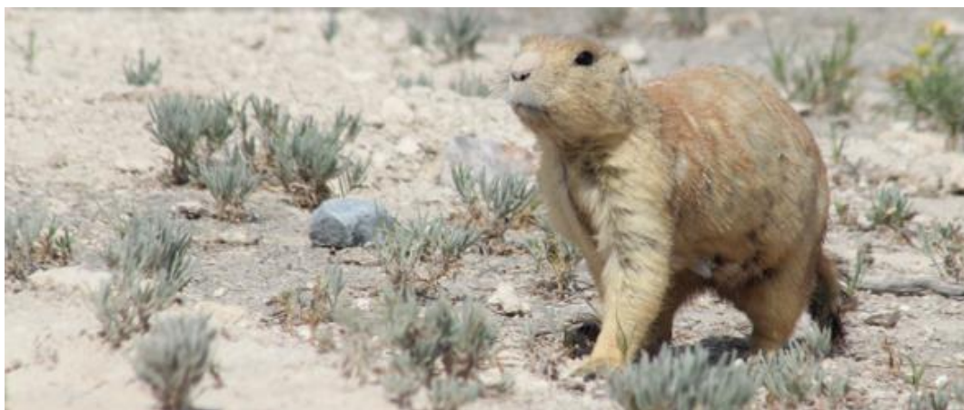
Figura 2. Hembra de Cynomys mexicanus . Fotografía de Horacio V. Bárcenas, Municipio de Vanegas, en San Luis Potosí, México (2019).