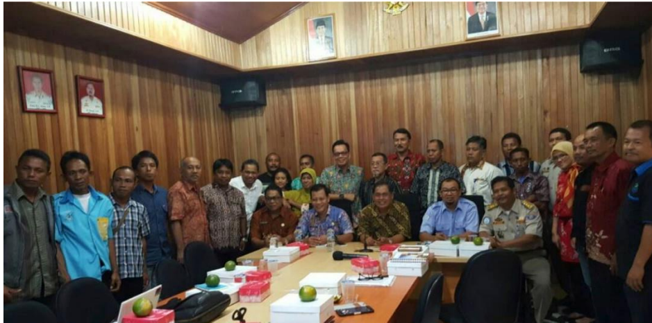
Figura 1. Reunión con el gobierno local e interesados en las islas de Banggai