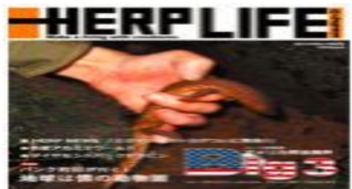
Image 5. Japan Herplife Magazine featuring Lanthanotus borneensis in 2012.

En 2012 apareció en el número 23 de la revista de reptiles japonesa HerpLife una imagen de un lagarto monitor desorejado vivo en la mano de alguien (Imagen 5). En el artículo se describe cómo el quipo de la expedición que trabajaba para la revista halló un espécimen en Borneo el 26 de noviembre de 2012 y tomó fotografías, una de la cuales era la imagen de la portada.