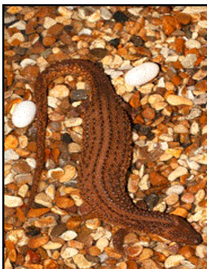
Image 4: Lanthanotus borneensis first reported offspring hatched in captivity, Japan, 2014