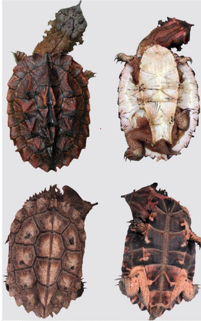
Figura 3. Fuente: Comparación de aspectos dorsal y ventral de Chelus orinocensis (arriba), hembra subadulta y Chelus fimbriata (abajo), hembra subadulta (Vargas-Ramírez et al. 2020)

Si bien las dos especies pueden tener el mismo tamaño alcanzando los 50 cm, habitan territorios diferentes, y las características físicas distintivas a nivel de cada especie están basadas en la coloración del plastrón, del dorso, así como la coloración y forma de caparazón.