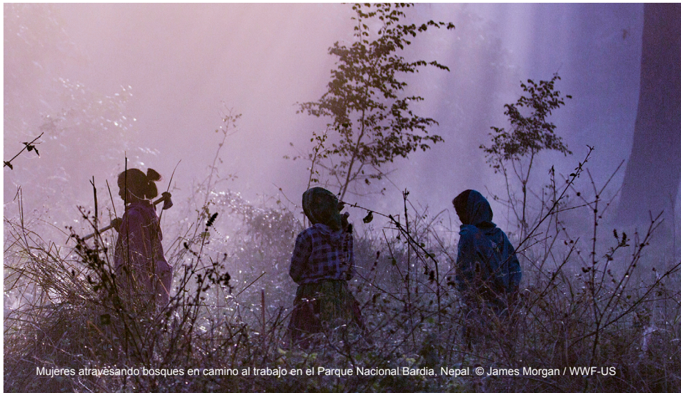
Mujeres atravesando bosques en camino al trabajo en el Parque Nacional Bardia, Nepal.