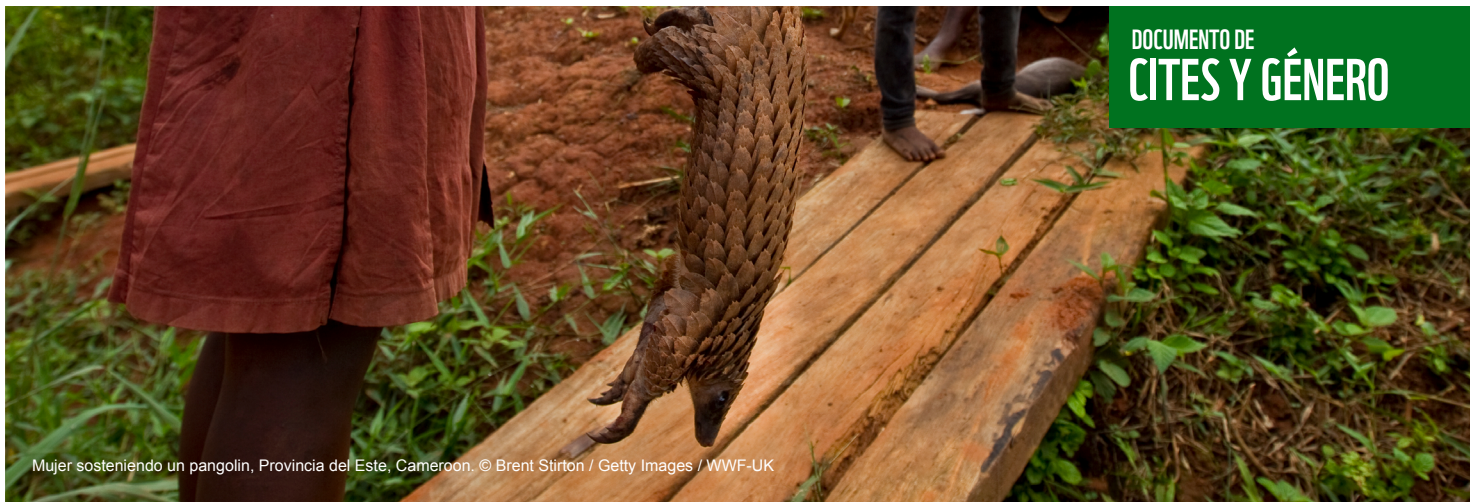
Mujer sosteniendo un pangolín, Provincia del Este, Camerún.

3. No se trata solo del género. La perspectiva de género también pone en evidencia otras identidades que pueden ser interseccionales, relativas al origen indígena o étnico, la raza, la clase social y la religión, entre otras.