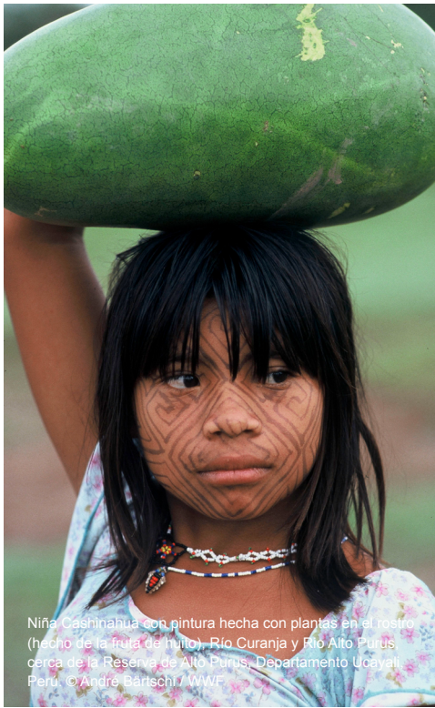
Niña Cashinahua con pintura hecha con plantas en el rostro (hecho de la fruta de huito), Río Curanja y Río Alto Putus, cerca de la Reserva de Alto Putus, Departamento Ucayali, Perú.