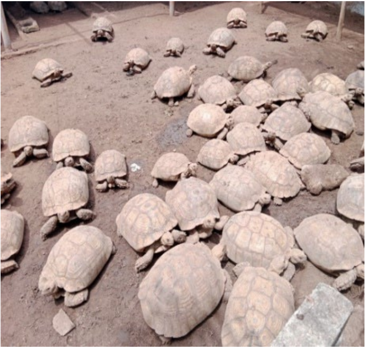
Centrochelys sulcata chez Mare (adultes reproducteur)