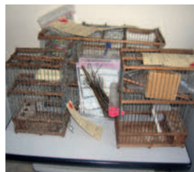
Cages pièges saisies

En Corrèze (19), le Service départemental a mis un terme à un braconnage de chardonnerets. Suite à un signalement émanant d'une association de protection de la nature, une enquête a été ouverte en février par les agents de l'ONCFS. Un individu agissant seul a été interpellé en flagrant délit. La perquisition de son domicile a permis de découvrir 3 cages pièges, 79 gluaux et 2 chardonnerets. De nombreuses cages vides ont permis de suspecter un trafic d'oiseaux.