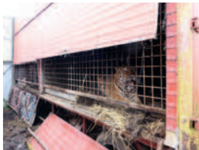
► Les portes des cages avaient été soudées et les félins, selon les affirmations du propriétaire, n'en sortaient qu'une fois par an

► En février, lors d'une opération de surveillance sur la commune d'Ardon dans le Loiret (45), les agents de l'ONCFS ont perçu le rugissement de félins. Sur demande du parquet, une opération regroupant l'ONCFS, Gendarmerie nationale, DDPP et pompiers a eu lieu. Durant la perquisition ont été découverts un lion et un tigre enfermés dans de très petites cages, ainsi que trois rats laveurs et une vingtaine de sangliers détenus illégalement. L'individu, violent et menaçant, a dû être maîtrisé par les gendarmes. Il a été condamné à six mois de prison ferme et à près de 2 000 euros de dommages et intérêts pour notamment insultes, rébellion et menace de mort.