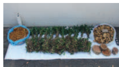
Saisie de fahams et autres végétaux protégés

En octobre, ces mêmes agents ont ouvert une procédure pour vente non autorisée de faham, une orchidée protégée endémique de la Réunion, inscrite à la Convention de Washington. Cette plante est traditionnellement utilisée pour aromatiser le rhum. Lors de l'interpellation de l'individu suspecté, une caisse d'environ 50 litres de fahams a été saisie. Ce délit est répréhensible d'un an de prison et de 15 000 euros d'amende.