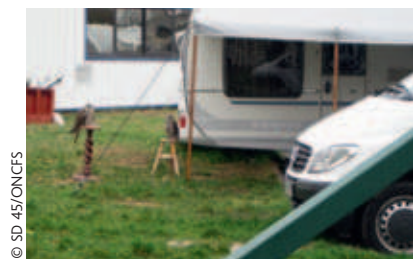
► Trois rapaces appartenant à l'espèce faucon sacre détenus dans une caravane

mois de prison ferme dans une affaire de vol en Meurthe-et-Moselle. Il a été placé en garde à vue et les faucons ont été saisis.