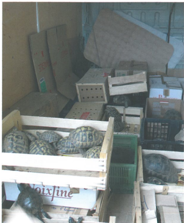
Une impressionnante saisie de 192 tortues sur la commune de Muro en Corse

En août 2013, après un an d'enquête et de collaboration avec la brigade de recherche de la Gendarmerie de Calvi en Corse, les agents de l'ONCFS ont démantelé, sur la commune de Muro, un trafic ayant conduit à la saisie de 192 tortues de sept espèces différentes, dont cinq protégées.