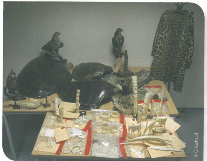
Saisie d'une centaine d'objets en ivoire dans le cadre de l'opération Hannibal appuyée par la BMI CITES dans les régions Auvergne et Languedoc-Roussillon

L'opération Hannibal organisée par le Réseau Commercialisation faune-flore ALR et appuyée par la BMI CITES a été menée dans neuf départements des régions Auvergne et Languedoc-Roussillon . Cette opération, dont l'objectif prioritaire fut le contrôle de la vente d'ivoire d'éléphant, a été effectuée dans de nombreux milieux tels que commissaires priseurs, hôtels des ventes, antiquaires, brocanteurs, marchés aux puces mais aussi sur les sites internet et chez les couteliers. Au total, 75 contrôles ont été déclenchés débouchant sur la saisie de plus de 160 objets de spécimens CITES et/ou protégés dont une centaine en ivoire. À cette occasion, une vingtaine de procédures judiciaires ont été initiées avec le relevé de 36 délits.