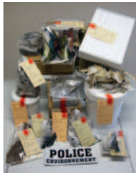
► Parties d'oiseaux et de mammifères lors de la perquisition

► À Châteauroux (36), en février dernier, le Service départemental de l'Indre a mis la main sur un vrai butin. Un annonceur était surveillé de près suite à la mise en ligne de ventes de crânes, pattes et os d'espèces de faune sauvage. Une perquisition à son domicile, à Menoux, a permis d'y découvrir de nombreuses parties d'oiseaux et de mammifères à des stades de transformation plus ou moins avancés ainsi que plus de 200 boîtes de plumes d'oiseaux. Depuis 2008, le vendeur tirait entre 500 et 800 euros de bénéfices sur les ventes. Une procédure a été ouverte pour commercialisation d'espèces protégées, pour infractions à la réglementation CITES, mais aussi pour travail dissimulé.