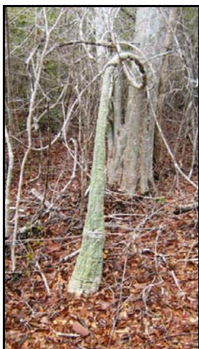
Individu adulte d' Adenia firingalavensis (Rakotondrabe, 2012)