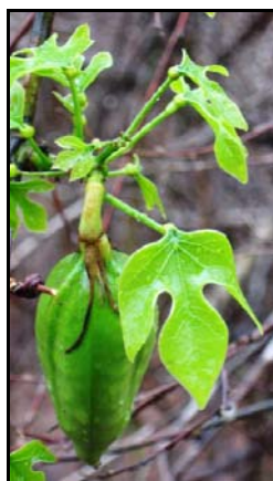
Rameau fructifère d' Adenia firingalavensis (Rakotondrabe, 2012)