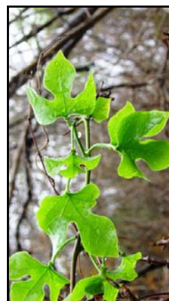
Rameau feuillé d' Adenia firingalavensis (Rakotondrabe, 2012)