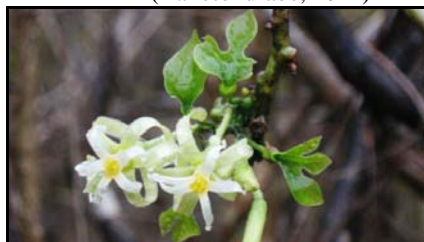
Rameau florifère d' Adenia firingalavensis (Rakotondrabe, 2012)