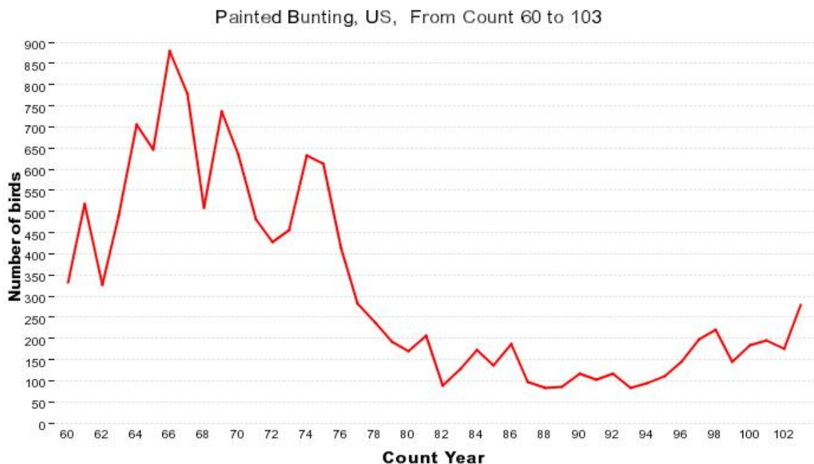
Figure 2. Données de comptages des oiseaux réalisés à Noël par la Société nationale Audubon pour la période internumériale. Année 60 = 1960, Année 102 = 2002.