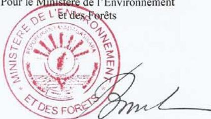
Jean Omer BERIZIKY Ministre de l'Environnement et des Forêts

Pour le Ministère de l'Environnement et des Forêts