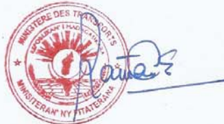
Ramarcel Benjamina RAMANANTSOA Ministre du Transport